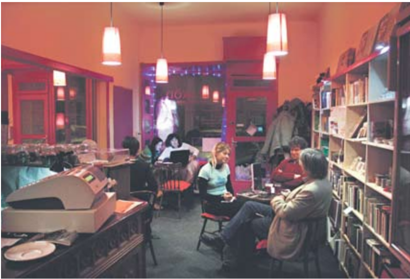
Csak úgy olvasgatni is lehet